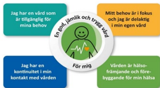
Figur 1: Strategiska målbilden för programmet: God, jämlik och trygg vård för våra invånare år 2030 1 .

Det länsgemensamma programmet Program God och Nära Vård i Västernorrland (nedan kallat programmet) ska stödja verksamheten i omställningen till Nära Vård så att länet tillsammans når det politiska målet om en god, jämlik och trygg vård för individen år 2030, se figur 1 nedan.