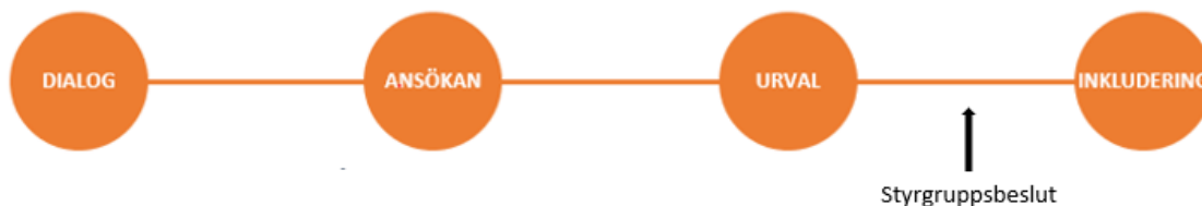
Figur 2: Programmets olika delmoment i den interna processen att samordna projekt för beslut om inkludering till projektportfölj. Fyra steg: dialog, ansökan, urval och inkludering med stygruppsbeslut som förutsättning.

Programmets interna process för att samordna projekt innehåller följande arbetsmoment: